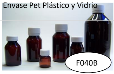
Envase Pet Plástico y Vidrio