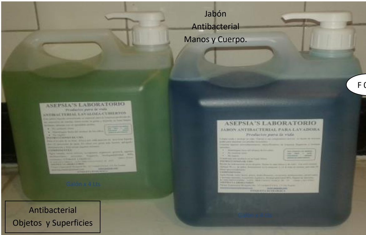
Jabón Antibacterial Manos y Cuerpo.