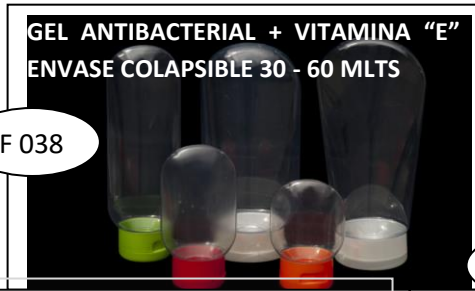
GEL ANTIBACTERIAL + VITAMINA "E" ENVASE COLAPSIBLE 30 - 60 MLTS