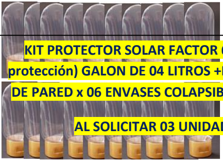
KIT PROTECTOR SOLAR FACTOR 60 (máxima protección) GALON DE 04 LITROS +DISPENSADOR DE PARED x 06 ENVASES COLAPSIBLE DE 50MLS.