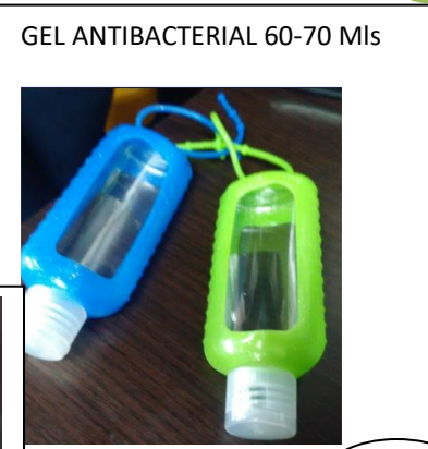
GEL ANTIBACTERIAL 60-70 Mls