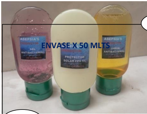
ENVASE X 50 MLTS