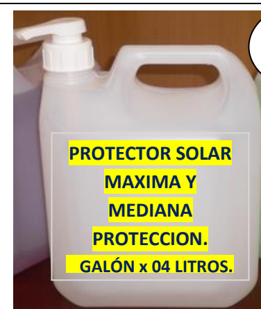
PROTECTOR SOLAR MAXIMA Y MEDIANA PROTECCION. GALÓN x 04 LITROS.