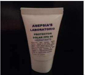
ENVASE COLAPSIBLE DE 10-20-30-50mlts GEL ANTIBACTERIAL. PROTECTOR SOLAR. CREMA MANOS. JABON ANTIBACTERIAL. ACEITES ESENCIALES. REPELENTE.